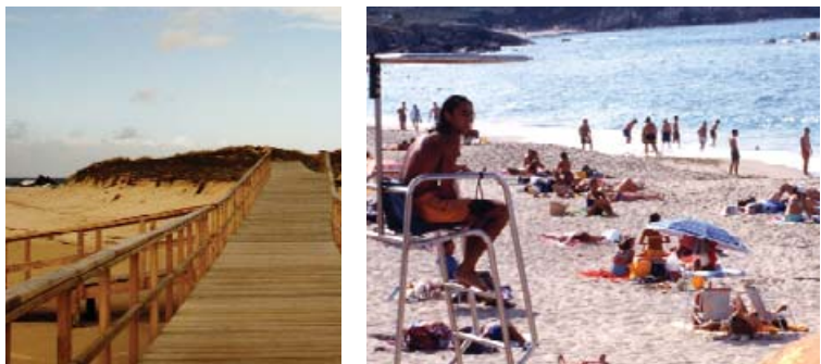
Areal de Barrañán

Os máis visitados son os de Barrañán (1200x12 m), As Combouzas (300x15m) e O Reiro (100x25 m). Estes areais están batidos polas bravas ondas do océano o que fai que as súas augas sexan limpas e a súa area de cor gris clara e fina. O areal de Barrañán, aberto e de forte ondada, ten un Paseo Marítimo nas súas inmediacións con espazos e mobiliario recreativos así coma un importante sistema de dunas. O areal das Combouzas é unha das poucas praias nudistas da provincia da Coruña.