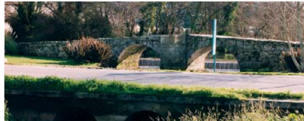
Ponte dos Brozos

Se encuentra en la parroquia de Santiago de Arteixo, en las inmediaciones de las naves del Polígono de Sabón. Atraviesa el río Bolaños y se trata de una obra de dos arcos con cortacorrientes en el medio de ellos y un ligero peralte, con rampas de acceso y la calzada original. Se conserva en buen estado y, según parece, pertenecería a la Vía XX, Per Loca Marítima, del itinerario del emperador Caracalla.