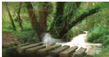
Fraga de Sisalde