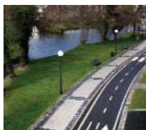
Paseo fluvial Arteixo