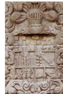
Pazo das Covadas