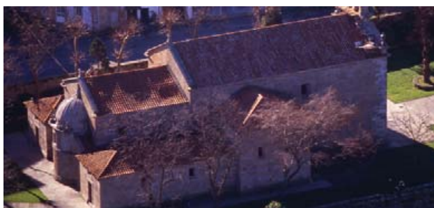
Iglesia de Pastoriza

Una importante lápida sepulcral, con una inscripción del año 881, se conserva en la Casa Rectoral, un antiguo y curioso capitel con "hojas de espadaña", aproximadamente del siglo IX así como unas dovelas de una arquivolta tórica, románica, del siglo XII.