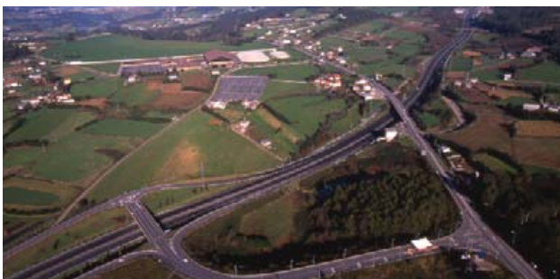
Vista a3rea da autoestrada

Ademais da autov3a Arteixo-Lugo-Madrid e a autoestrada A Coru3a-Carballo que pasan por este municipio, hai unha extensa rede de estradas secundarias que experimentaron unha gran mellora no seu trazado e no seu firme, o que beneficia o percorrido por todos os recunchos deste termo municipal.