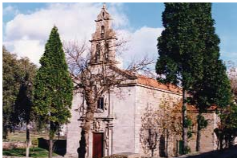
Santa María de Pastoriza