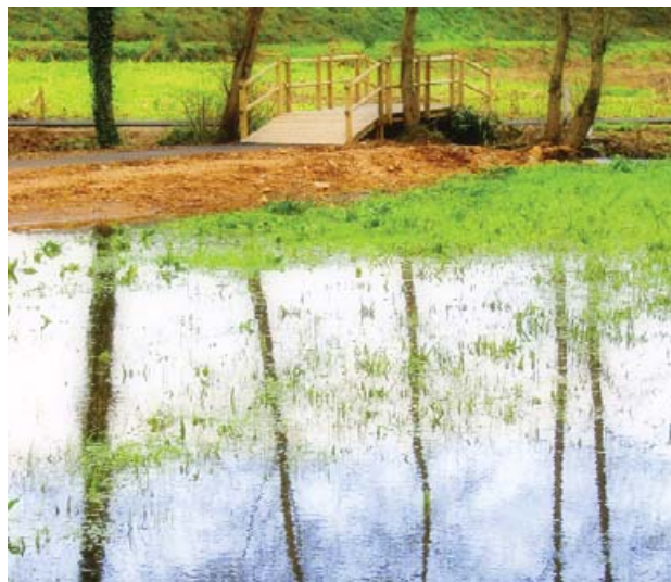
Área recreativa do Seixedo