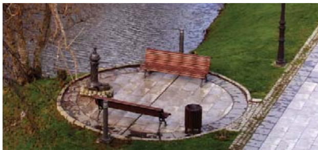
Paseo fluvial de Arteixo