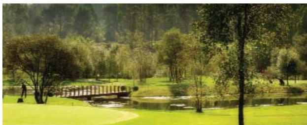
Instalacións Hércules Club de Golf (Larín)