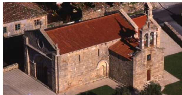
Iglesia de Oseiro

Esta iglesia, de estilo románico, (1161-64) posee, entre los canecillos, uno en el cual se representa un cáliz con hostia que puede ser la representación más antigua que se conoce del escudo de Galiza. Conserva dos inscripciones históricas referentes a la construcción y consagración de la misma, una de la segunda mitad del siglo XII, en la fachada, y otra mutilada, en el interior del ábside, de principios del XIII, referente a la consagración.