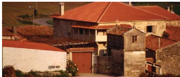
Pazo das Covadas

El edificio es de dos cuerpos con un portón con arco de medio punto formado por firmes dovelas. Destaca en el mismo su gran y majestuoso balcón angular que está sostenido por poderosas ménsulas. Posee dos escudos y, en el más antiguo, se aprecian las armas de los Rioboo, Villardefrancos, Castro, Figueroa y algún otro cartel de complicada interpretación. En el blasón más moderno, barroco, en el medio de una gran ostentación y bajo yelmo adornado de aparatosos lambrequines, figuran las empresas de los Bermúdez, Castro, Lobera, Caamaño, Andrade, Villardefrancos y Varela.