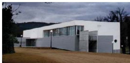
Centro Cívico Cultural