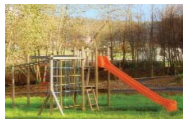
Área recreativa do Seixedo