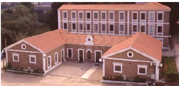
Balneario de Arteixo

Sitúase no casco urbano de Arteixo a escasos metros do Paseo Fluvial no río Bolaños, a un quilómetro da costa e a 11 Km da Coruña.