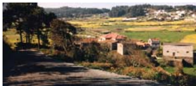
Valgada de Sorrizo

En canto á súa natureza salienta a botánica, a fauna e as paisaxes con amplas vistas panorámicas.