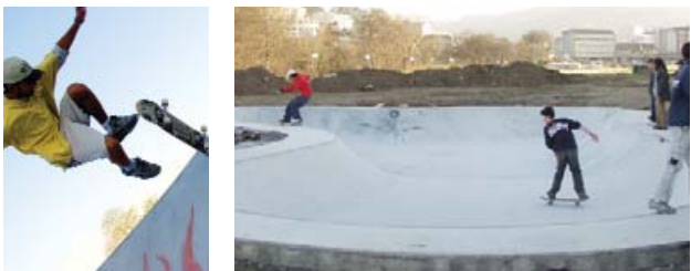
Pista de skate