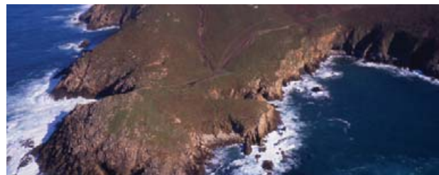
Costa de Suevos

En canto a peixes e mariscos hai unha gran variedade sendo os máis saborosos os que se pescan na proximidade da costa: linguado, mero, pescada, rodaballo, robaliza, maragota, merlón, congro, sardiña, xurelo...No litoral de Sorrizo hai boas raías, maragotas, merlóns, polbos, luras e congros o mesmo ca no Llol en Rañobre onde tamén hai pintos e rebiogas Degústanse á prancha, en caldeirada ou adobados por especialistas na cociña.