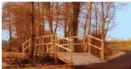
Paseo fluvial do Seixedo