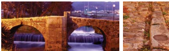
Ponte dos Brozos

Atópase na parroquia de Santiago de Arteixo, nas inmediacións das naves do Polígono de Sabón. Atravesa o río Bolaños e trátase dunha obra de dous arcos con cortacorrentes no medio deles e un lixeiro peralte, con ramplas de acceso e a calzada orixinal. Consérvase en bo estado e, ao parecer, pertencería á Vía XX, Per Loca Marítima, do itinerario do emperador Caracalla.