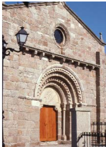
Igrexa de Oseiro

No adro hai dous sarcófagos, un antropoide e o outro cunha interesante cuberta das chamadas de "estola", con curiosos relevos.