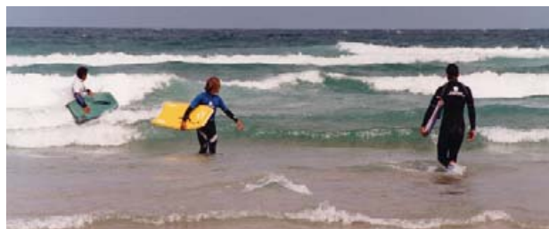
Afeccionados ao surf