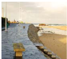
Paseo Marítimo de Barrañán