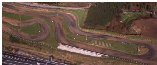
Circuíto de autocross