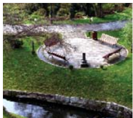
Paseo fluvial de Arteixo