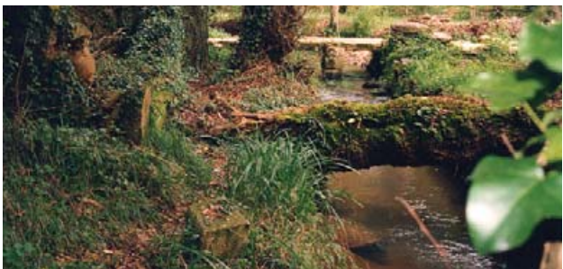
Fraga de Sisalde

O val de Barrañán, polo que discorre o río Boedo, é outro espazo natural que cómpre salientar na xeografía municipal, destacando especialmente as brañas da parte baixa do leito do río e o bosque de Sisalde. Este espazo non só se distingue pola importancia de diferentes aspectos ambientais, senón tamén polas abundantes mostras da conxunción que os nosos antepasados mantiñan co medio natural, que se manifesta na riqueza etnográfica da zona. Parte destas riquezas ambientais e etnográficas atópanse esquecidas e deterioradas actualmente, motivo polo cal se están a desenvolver accións e investimentos para a súa recuperación.