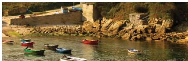
Porto de Sorrizo