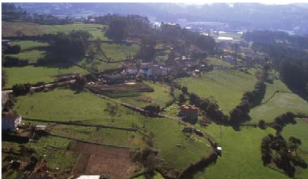
Valle de Barrañán

buceadoras: el porrón común ( Aythya ferina ) y el porrón moñudo ( Aythya fuligula ), ya que es Arteixo uno de los poquísimos lugares de toda la Península Ibérica en el que se reproducen con regularidad.