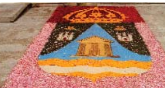
Festa das flores

▶ Durante todo o ano as parroquias do Concello de Arteixo gozan de festa e ledicia. Os seus festivais, con vestimentas típicas enchen as rúas e as prazas locais. Desde a Feira Histórica "Arteixo 1900" até as citas con artistas locais, rexionais, nacionais ou internacionais, a súa oferta une modernidade e tradición.