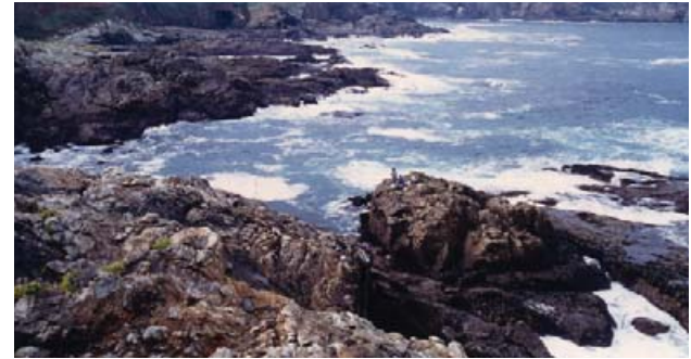
Ensenada de Lourido

merluza, rodaballo, robaliza, maragota, merlón, congrio, sardina, jurel... En el litoral de Sorrizo hay buenas rayas, maragotas, merlóns, pulpos, calamares y congrios lo mismo que en O Llol en Rañobre donde también hay pintos y rebioigas. Se saborean a la plancha, en calderada o adobados por especialistas en cocina.