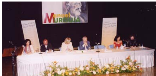
Certame de narracións breves Manuel Murguía