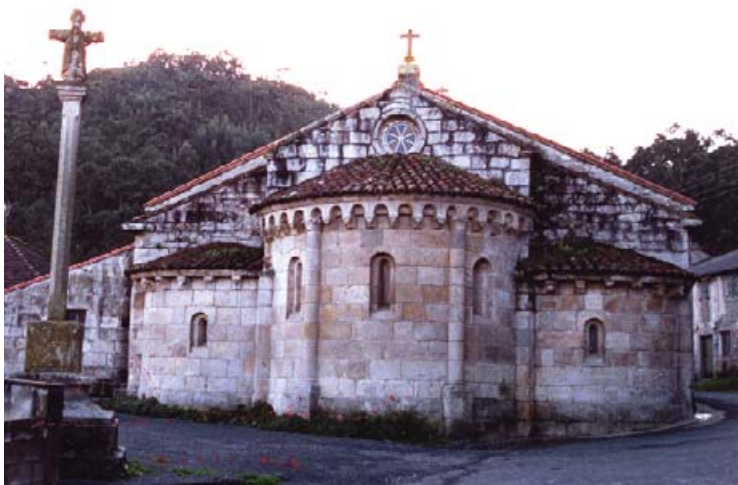
Igrexa de Monteagudo

A cuberta é a dúas augas e a planta basilical, de tres naves e tres ábsidas semicirculares nos que se abren sinxelas xanelas con arco de medio punto agregadas a corpos ou tramos rectangulares. A porta principal é moderna e a do muro norte, de arco semicircular, está tapiada; a do sur ten unha arquivolta semicircular tórica sobre unha columna por lado. Os arcos de ingreso ás tres ábsidas son apuntados sobre semicolumnas acaroadas, pero os