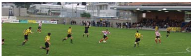
Campo de fútbol de Arteixo