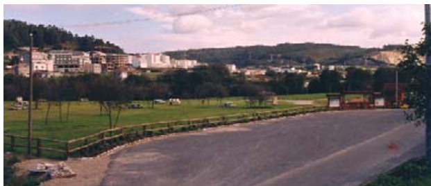
Área recreativa do Seixedo