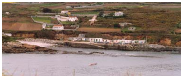
Puerto de Suevos

En la parroquia de Oseiro está la playa de Alba-Sabón (900x40m), cuyas características son óptimas para la práctica del surf.