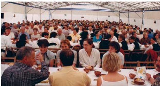
Festa dos callos

Este concello conta con hoteis, hostais, restaurantes, grelladas e cafetarías onde se poden degustar os máis saborosos mariscos, carnes e peixes e onde a paz e a tranquilidade que proporciona a vila, a fan inmillorábel para o descanso que se pode acadar, entre outros lugares, no seu Balneario de augas cálidas. Non se debe marchar de Arteixo sen probar o polbo á feira na Romaría do Seixedo que cocido, cortado, adobado con pemento, sal e aceite cru constitúe un exquisito manxar ou ben, gozar da Festa Gastronómica dos Callos no mes de maio; é unha boa maneira de probar os deliciosos manxares que se preparan neste municipio.