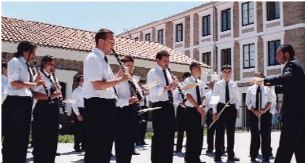
Banda de música de Arteixo