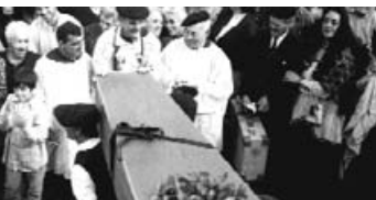
Festa histórica de Arteixo 1900