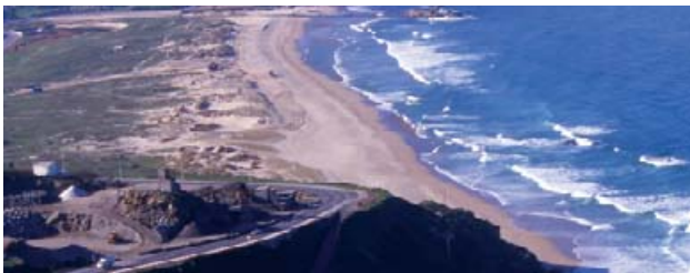
Playa de Barrañán

Las más visitadas son la de Barrañán (1200x12 m), As Combouzas (300x15m) y O Reiro (100x25m). Estas playas están batidas por las bravas olas del océano lo que hace que sus aguas estén siempre limpias y su arena de color gris claro y fina. La playa de Barrañán, abierta y de fuerte oleaje, tiene un Paseo Marítimo en sus inmediaciones con espacios y mobiliario recreativos así como un importante sistema de dunas. La playa de As Combouzas