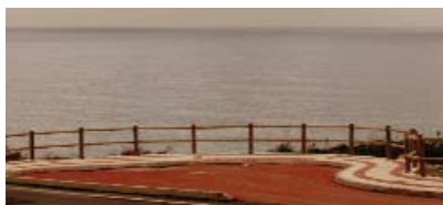
Paseo Marítimo Arteixo-Barrañán