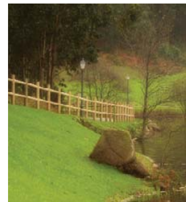
Área recreativa de Meicende