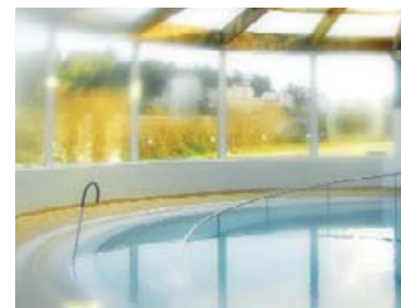
Piscina Municipal de Arteixo