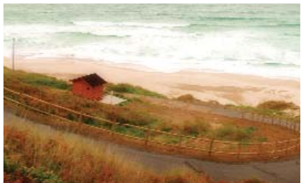
Areal das Combouzas (nudista)

Todos eles contan con bos servizos turísticos como limpeza, aparcamento, duchas, sendeiros e ramplas de acceso, socorrismo e restaurantes.