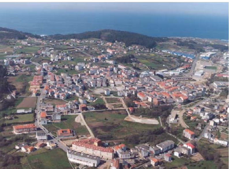
Vista aérea de Arteixo