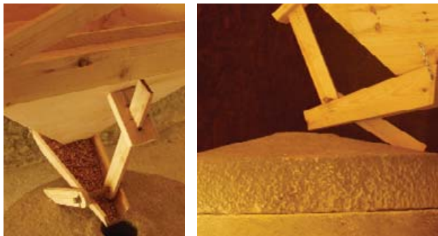
Muiño de Sisalde

En el Proxecto Toponimia de Galiza se han registrado más de cien molinos, muchos de los cuales ya están desaparecidos. El único que funciona con regularidad es el Molino de Margarida en Santaia de Chamín.