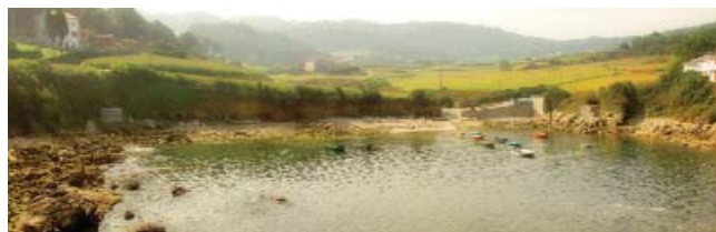
Porto de Sorrizo

En Suevos hai pequenos areais e un porto que, xunto co de Sorrizo (90x10 m), son os dous máis salientábeis do concello, aproveitados polos afeccionados á pesca e para o baño relaxado nas súas tranquilas augas.