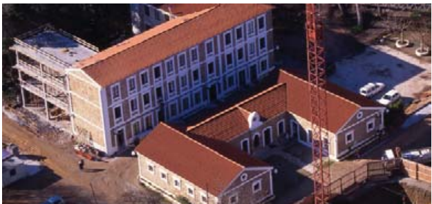
Balneario de Arteixo

Su existencia data del año 1760. Es famoso por sus aguas iodurobromuradas que salen a una temperatura que oscila entre los 25 y los 45 grados con propiedades curativas, buenas para las enfermedades de la piel, reuma, trastornos respiratorios o problemas psico-nerviosos.