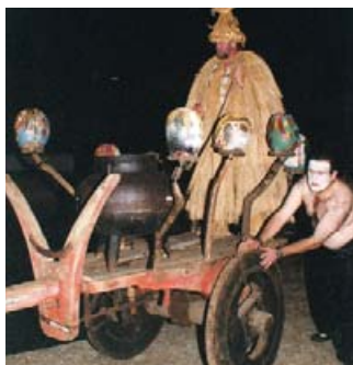
Queimada na Feira Histórica Arteixo 1900