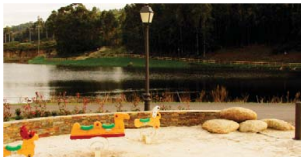
Área recreativa de Meicende