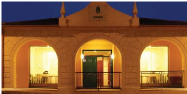
Centro dos vellos