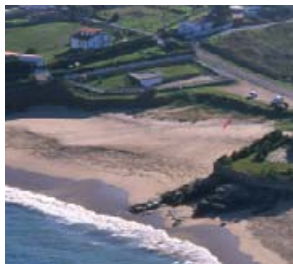
Areal do Reiro

Os máis visitados son os de Barrañán (1200x12 m), As Combouzas (300x15m) e O Reiro (100x25 m). Estes areais están batidos polas bravas ondas do océano o que fai que as súas augas sexan limpas e a súa area de cor gris clara e fina. O areal de Barrañán, aberto e de forte ondada, ten un Paseo Marítimo nas súas inmediacións con espazos e mobiliario recreativos así coma un importante sistema de dunas. O areal das Combouzas é unha das poucas praias nudistas da provincia da Coruña.