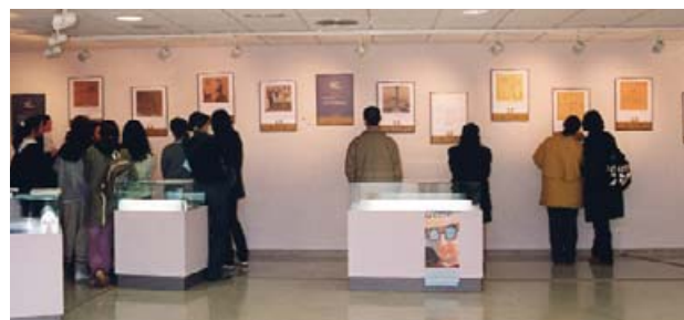
Exposición Castelao e Nós