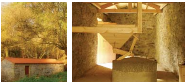
Muíño de Sisalde

No Proxecto Toponimia de Galiza rexistráronse máis de cen muíños, moitos deles desaparecidos. O único que funciona con regularidade é o Muíño de Margarida en Santaia de Chamín.