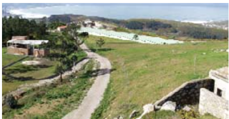
Área Recreativa do Monticaño