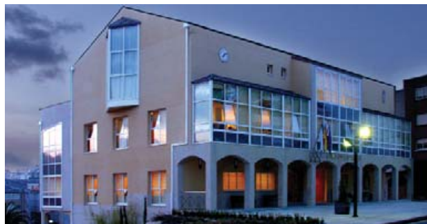
Casa do Concello