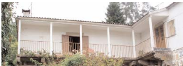
Pazo do Atín

Según documentación que data del año 1675 se constata que los amos en aquella época eran los señores de la casa Pardo Osorio. Más tarde, como consecuencia de la desamortización, ha pasado a la familia Pereiro en el siglo XIX, industriales coruñeses muy conocidos.