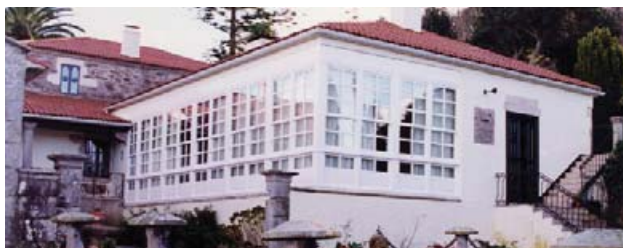
Pazo de Anzobre

Este pazo, del siglo XVII, está situado en la parroquia de Armentón y conjuga la antigua cantería y la moderna galería de cristales. Posee una capilla con acceso por el exterior y en la que se celebra la romería de los Remedios.