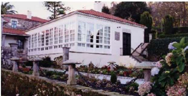
Pazo de Anzobre