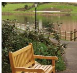
Área Recreativa de Meicende